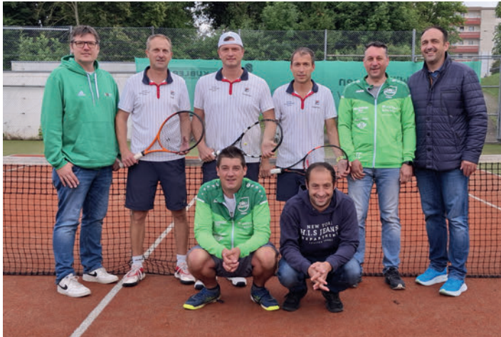
Herren Team 30

Eine sehr starke Runde spielte unsere Herren 30 Mannschaft. Nur dem TA SpVgg Hengstfeld musste man sich geschlagen geben. Siege gegen Unterrot, Untergrönningen, Stödtlen und Jagstheim ergaben den 2. Platz in der Bezirksstaffel 1. Herzlichen Glückwunsch!