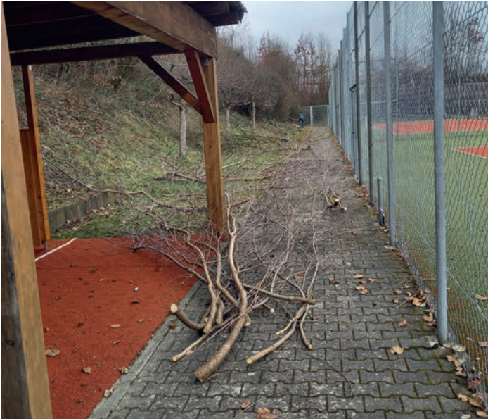
Frühjahrsschnitt an der Anlage

Nur durch das Engagement von tatkräftigen Mitglieder der Abteilung konnte die Tennis-Anlage wieder als Schmuckstück da stehen. Ob es die Platzpflege selbst war, die vielen Arbeiten im angrenzenden Gelände – Baum und Schnittpflege – oder der Betrieb unseres „Häusle“ selbst.