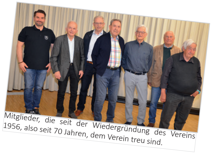
Mitglieder, die seit der Wiedergründung des Vereins 1956, also seit 70 Jahren, dem Verein treu sind.