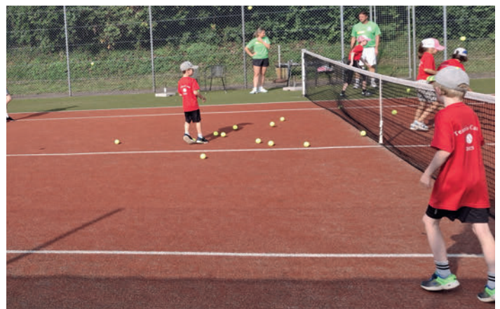
Übungseinheit beim Kids Mini Camp