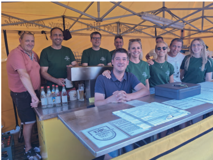
Ausschank-Team Wasseralfinger Tage