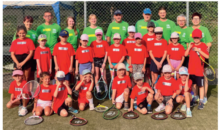
Teilnehmer und Betreuer Mini Camp

Bereits zum 13. Mal wurde auf der Tennisanlage ein 2-tägiges Tenniscamp durchgeführt. 20 Kids wurden zwei Tage lang nach dem Konzept Play + Stay Rote Stufe des Tennisverbandes zum Tennissport geführt. Bedingt durch das niedere Durchschnittsalter der Kids – viele ab 5 Jahre – war es für die 10 Betreuer/Trainer durchaus eine besondere Herausforderung. Daher war viel Spiel, mit und ohne Ball – auch außerhalb des Tennisplatzes – angesagt. Eine Abwechslung und gleichzeitig ein Highlight war am Samstag dann der Besuch des Explorhino in Aalen. Der sportliche Abschluss mit einem altersgerechten Wettbewerb beendete das Tenniscamp. Nach der Pokalübergabe stellten sich die Teilnehmer zufrieden, strahlend und stolz dem Fotografen.