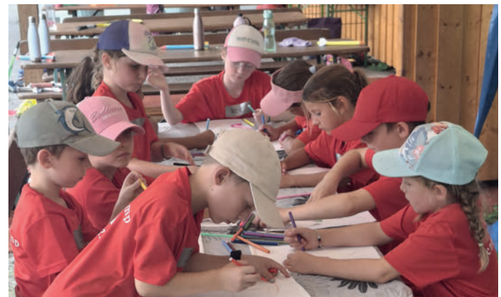
Pause im Kids Mini Camp