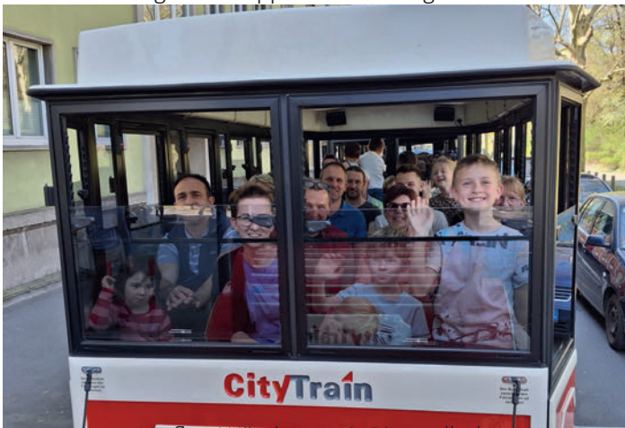
Ausflug Würzburg mit Bimmelbahn

Nicht mit einer Wanderung, nein mit einem Abteilungsausflug begann das Tennisjahr 2025. Es reichte gerade ein 50er Omnibus um Jung und Alt am 05.04.2025 nach Würzburg zum Etappenziel zu bringen.