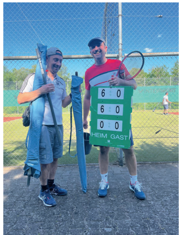
Auch so kann ein Doppel gewinnen